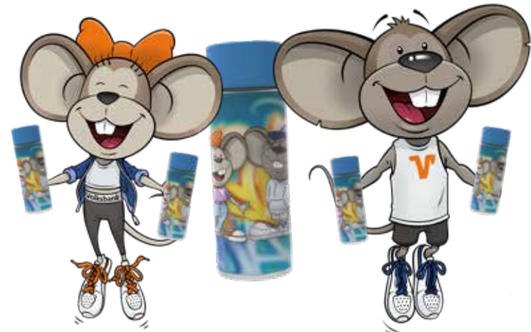
Nur solange der Vorrat reicht!

Ausreichend zu Trinken ist wichtig – gerade jetzt im Sommer. Da haben Hanni und Manni genau das Richtige für dich: eine tolle Flasche! Ideen, wie dein Wasser auch einmal anders schmecken kann, findest du hier: volksbanking.de/trinken Bring einfach den Coupon im August in deine Filiale oder zeig ihn digital auf dem Smartphone vor und hol dir deine Wasserflasche bei uns ab.