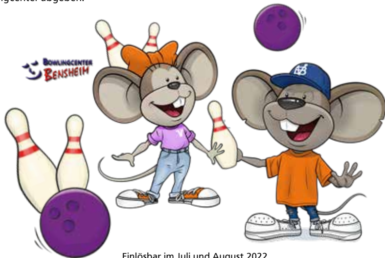
Einlösbar im Juli und August 2022

Wie wäre es mit einem Bowling-Nachmittag in Bensheim, zusammen mit deiner Familie oder deinen Freunden? Hanni und Manni haben dort nämlich eine Vergünstigung für euch klargemacht: Im Juli und August erhaltet ihr im Bowlingcenter Bensheim einen Rabatt von 2,50 Euro. Pro Person und Besuch können alle, die mit dir spielen, einen Coupon einlösen. Dafür einfach den Coupon ausdrucken und im Bowlingcenter abgeben.